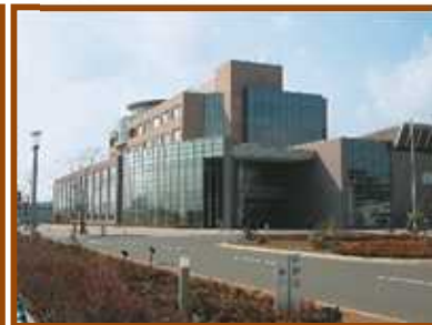
奥州市役所江刺支所から 1.3km