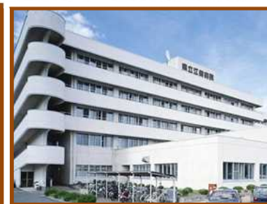
県立江刺病院から 1.5km