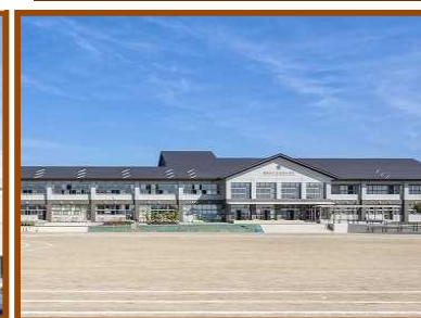
岩谷堂小学校から 2.0km