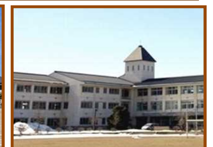
江刺第一中学校から 1.9km